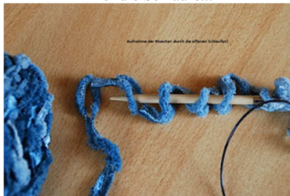
das Auffädeln auf die Nadel...hierfür einfach mit der Nadel durch die Schlaufen...