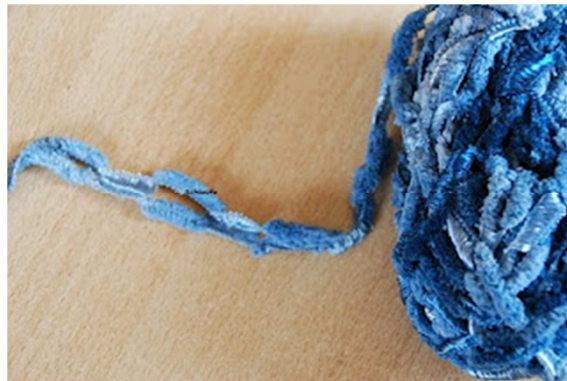
hier die Schlaufe...

Wie versprochen hier mal meine Bilderdoku, wie mit dem Schlaufengarn gestrickt wird!